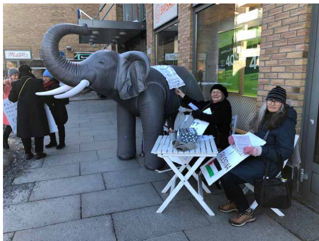
Freds- og miljøelefanten har vært med på flere aksjoner i Oslo og Akershus dette året. Her fra Mortensrud torg i Oslo.

Senere på våren hadde aksjonsgruppa et lignende opplegg på Tøyen. Her måtte folkemøtet sløyfes på grunn av at biblioteket var opptatt på ønsket tidspunkt. Til gjengjeld ble standen utvidet med